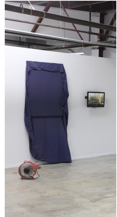
Cosas que mueve el viento, 2015-17 Sábana (Cover fitted) y bastidor de madera / 2' x 3' Video 1920 x 1080 / Duración 44:14