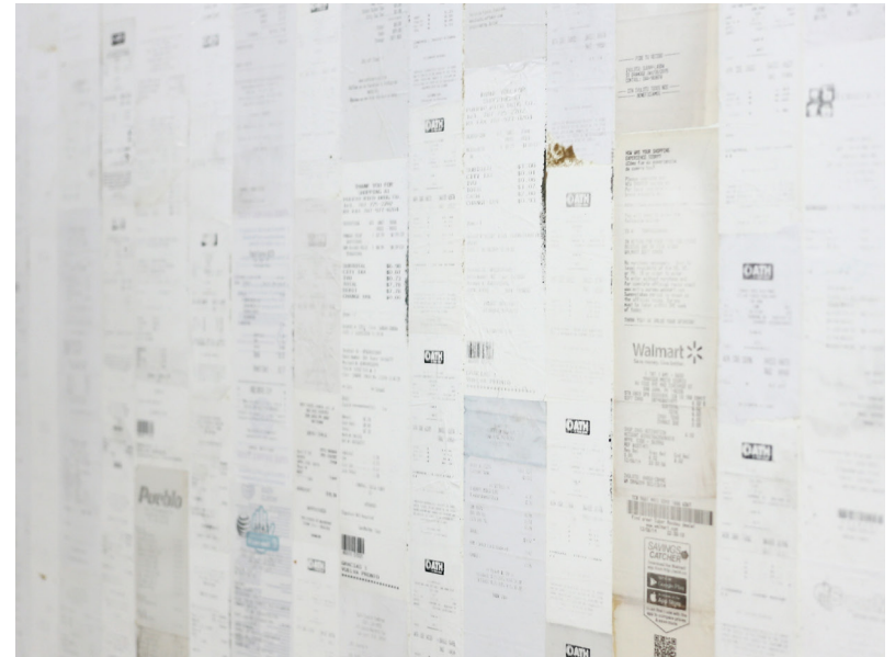
Acumulación a dos franjas / segmento, 2014 - 2017

Colección de recibos y transacciones de compras