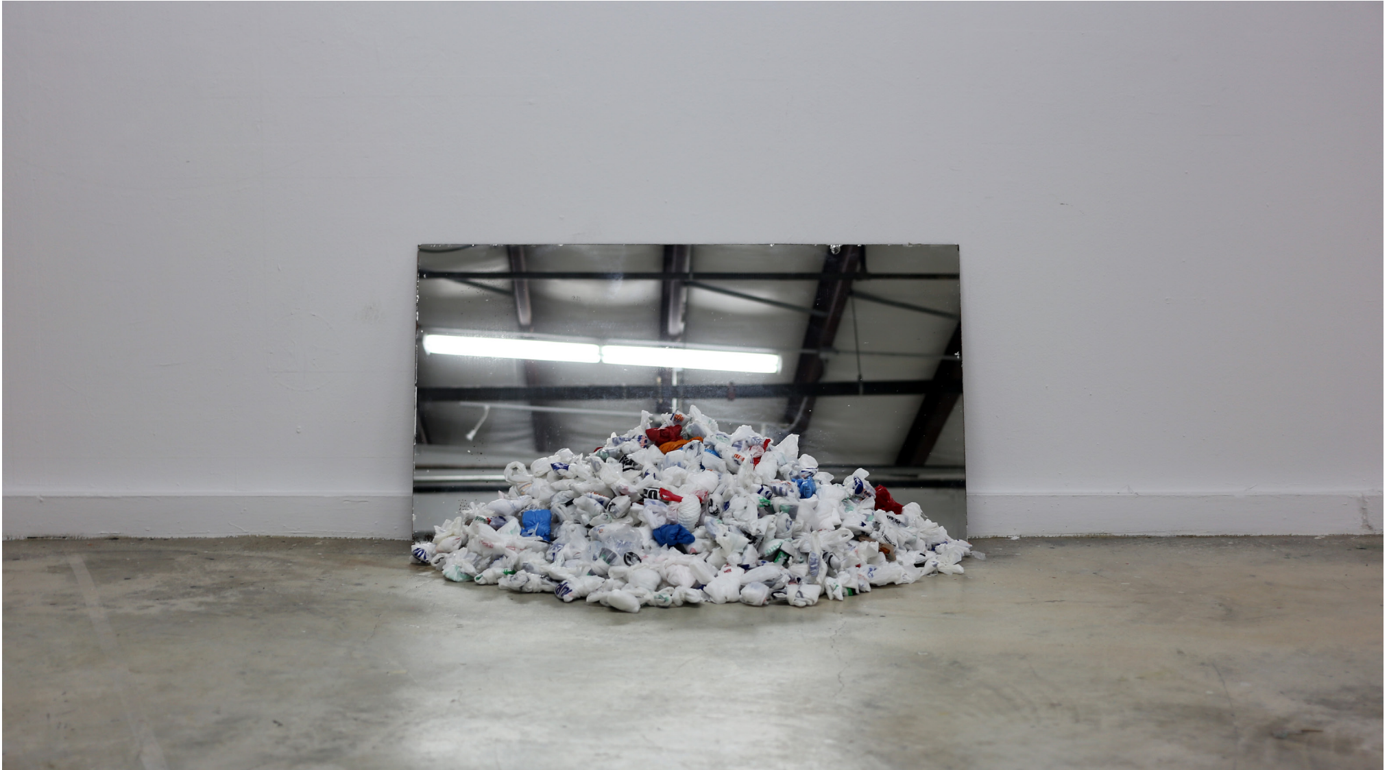
Acumulación y proyección, 2017