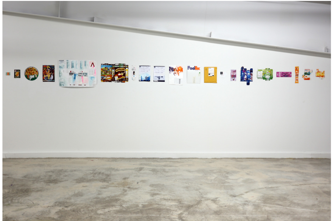
Otras formas de obsolescencia , 2017

Acrílico sobre empaques, promociones y etiquetas Medias variables