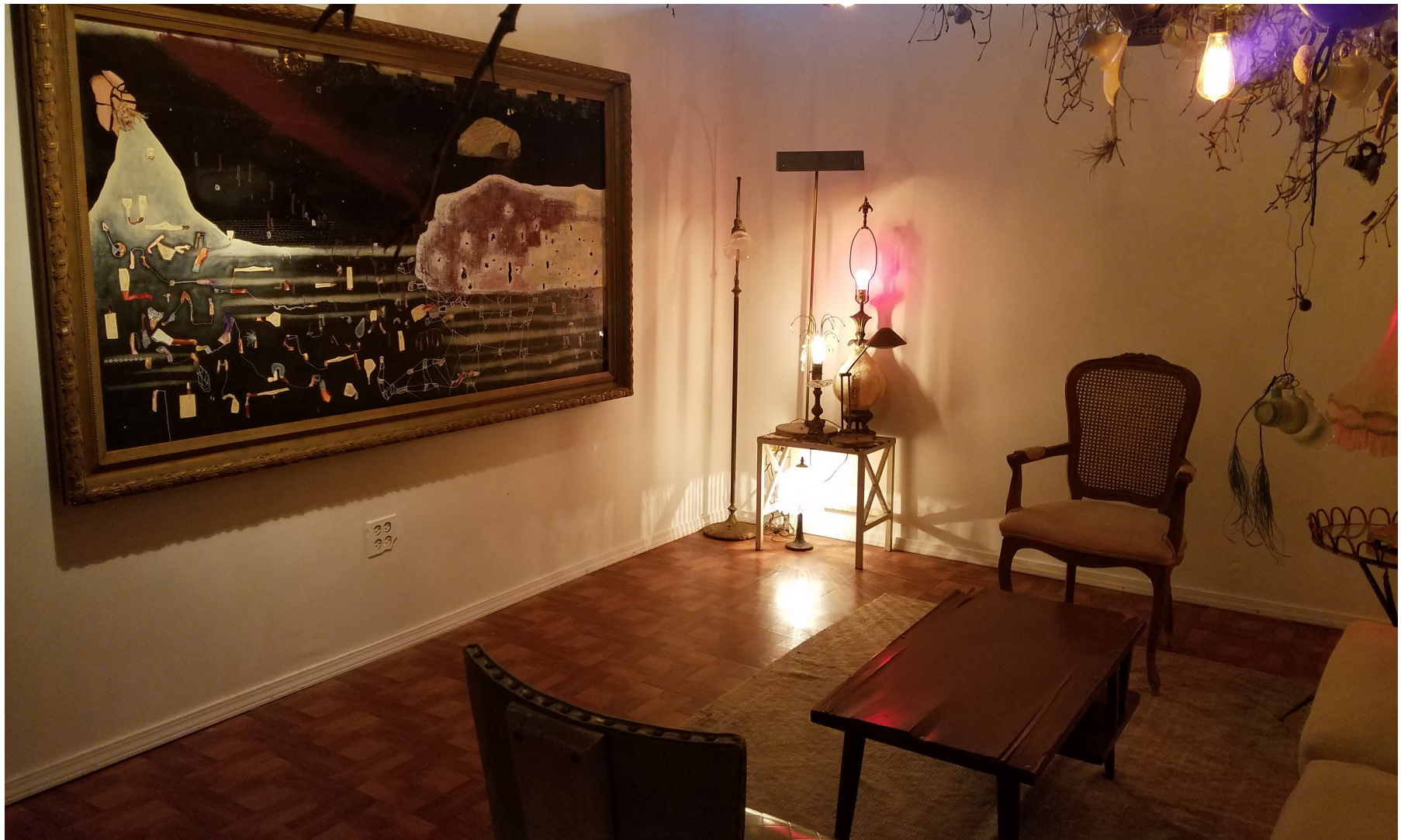
La Lámpara y Den Bosche (El Bosque), 2017