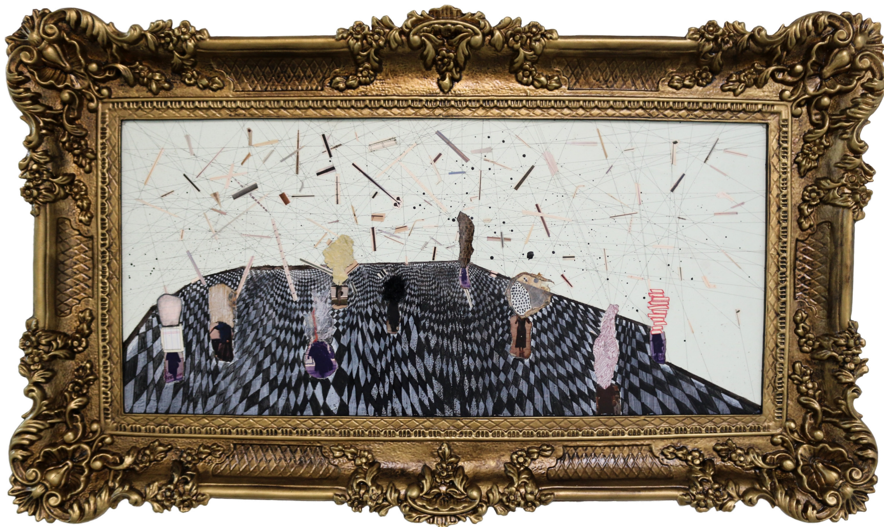
Electric Disco , 2017

Medio mixto (pintura aerosol, pintura acrílica, barniz de madera, tinta, fotografías, papel, papel de aluminio, tela, y tape en un marco pintado)